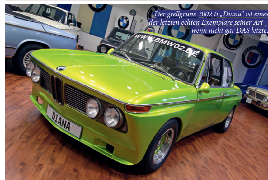
Der grellgrüne 2002 ti „Diana“ ist eines der letzten echten Exemplare seiner Art – wenn nicht gar DAS letzte.