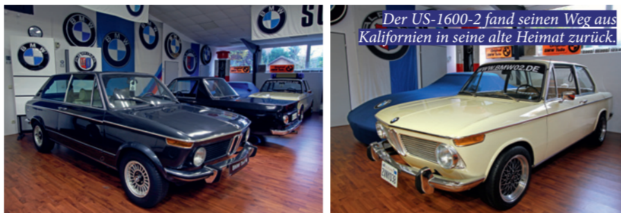
Der US-1600-2 fand seinen Weg aus Kalifornien in seine alte Heimat zurück.