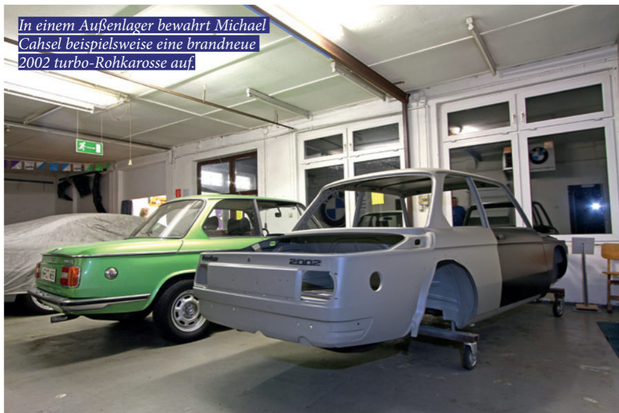
In einem Außenlager bewahrt Michael Cahsel beispielsweise eine brandneue 2002 turbo-Rohkarosse auf.