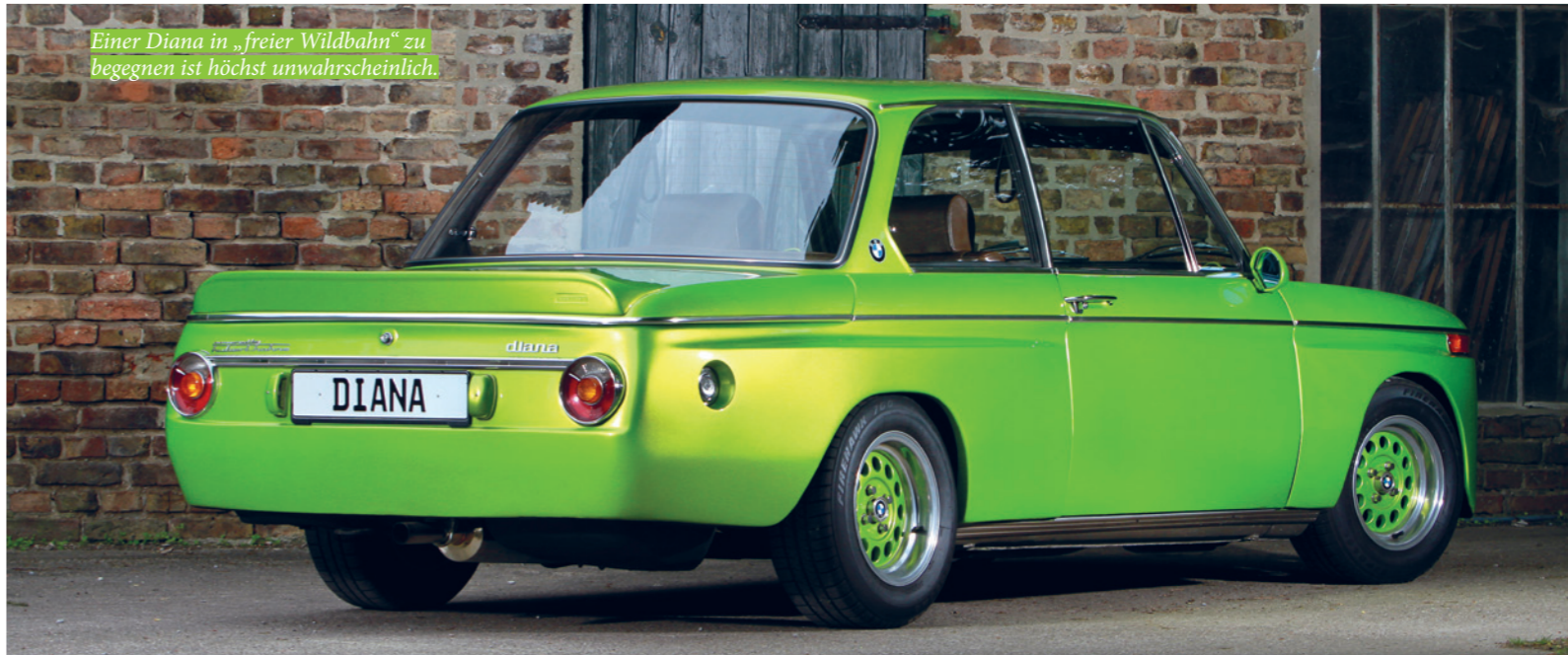
Einer Diana in „freier Wildbahn“ zu begegnen ist höchst unwahrscheinlich.