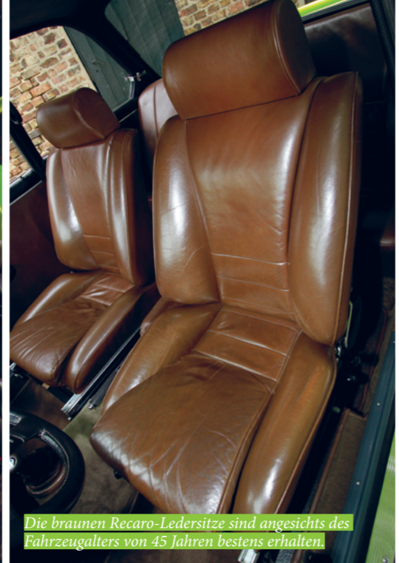
Die braunen Recaro-Ledersitze sind angesichts des Fahrzeugalters von 45 Jahren bestens erhalten.