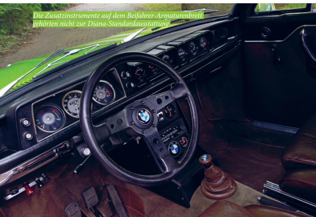
Die Zusatzinstrumente auf dem Beifahrer-Armaturenbrett gehörten nicht zur Diana-Standardausstattung.